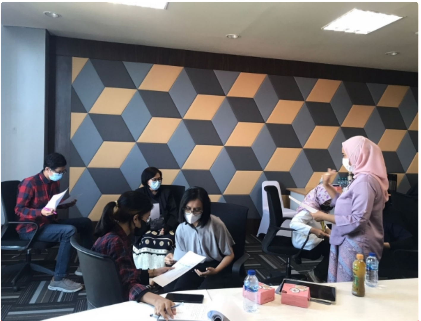
Satgas PPKS UNAIR dalam kegiatan Pelatihan Penanganan Korban Kekerasan Seksual pada Jumat (23/9/2022) di ASEEC Tower UNAIR.

SURABAYA— Sebagai bentuk keseriusan dalam memberantas kekerasan seksual, Universitas Airlangga (UNAIR), menyelenggarakan pelatihan penanganan korban kekerasan seksual pada Jumat (23/9/2022). Kegiatan yang